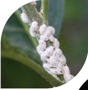
Narenciye Unlu Biti

Novagard CS, zararlı böcek sinir sisteminde Glutamat -kapılı klorid kanalı (GluCl) aktivasyonunu bozarak ve asetil CoA karboksilaz inhibitörü olarak birleşik yüksek etki gösterir.